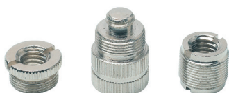
A1 A2 A3