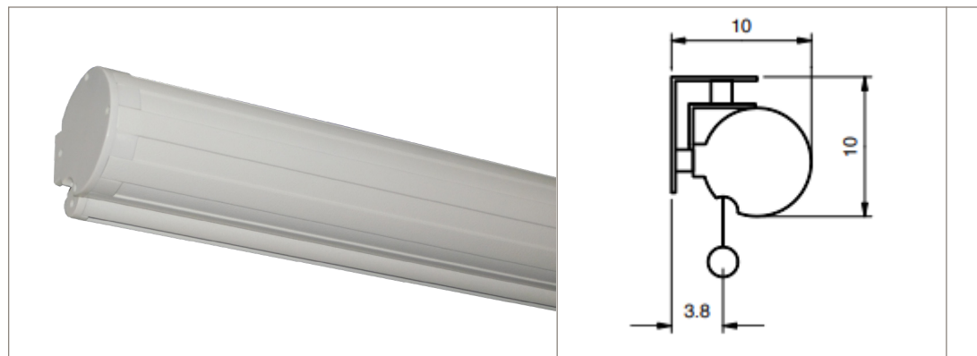
Schéma branchement télécommande et interrupteur