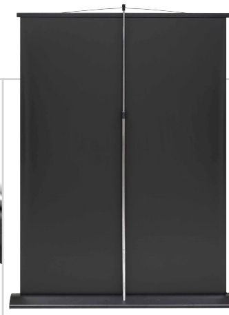
Vue de dos