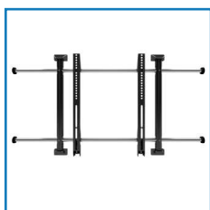
Minimalistyczny design i funkcjonalność