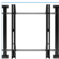
Szeroki zakres otworów montażowych VESA