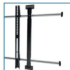
Prosta i szybka instalacja